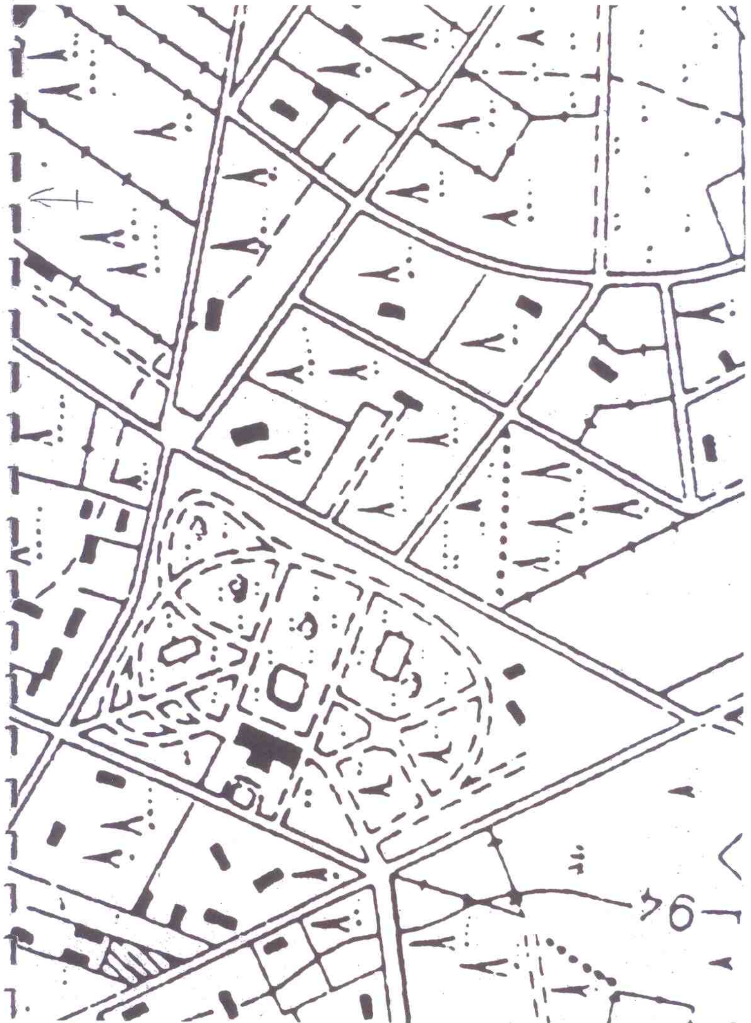
BIBLIOTEKA NARODOWA - ZBIORY KARTOGRAFICZNE, WIG 1933, PAS 40 - SŁUP 32F, S - 19551